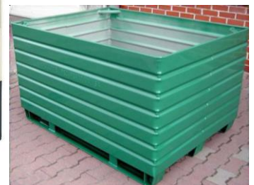
Caisses en métal

D'un volume max. de 3 m 3 et d'une hauteur max. d'1,5 m, les conteneurs doivent être remplis sans que les DEEE puissent en tomber: il ne faut donc pas dépasser une hauteur de remplissage et prévoir des côtés et un fond suffisamment fermés. Si nécessaire, les conteneurs doivent être habillés par exemple d'un film intérieur indéchirable pour les caisses grillagées ou d'un revêtement de fond pour les palettes en bois.