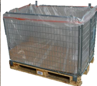
Caisses grillagées (avec habillage si nécessaire)