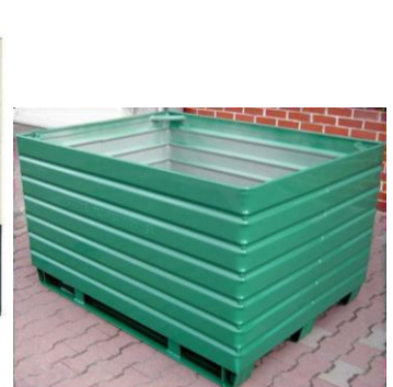
Caisses en métal

D'un volume max. de 3 m 3 et d'une hauteur max. d'1,5 m, les conteneurs doivent être remplis sans que les DEEE puissent en tomber: il ne faut donc pas dépasser une hauteur de remplissage et prévoir des côtés et un fond suffisamment fermés. Si nécessaire, les conteneurs doivent être habillés par exemple d'un film intérieur indéchirable pour les caisses grillagées ou d'un revêtement de fond pour les palettes en bois.