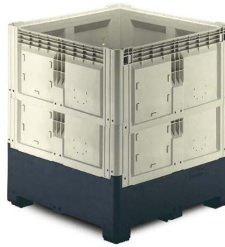
Paloxes en plastique