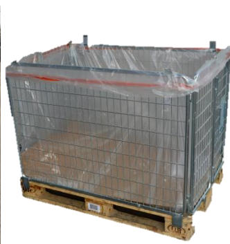
Caisses grillagées (avec habillage si nécessaire)