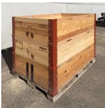
Palettes avec 3 cadres max. (avec habillage si nécessaire)