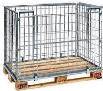
Gitterboxen (wenn nötig mit Auskleidung)